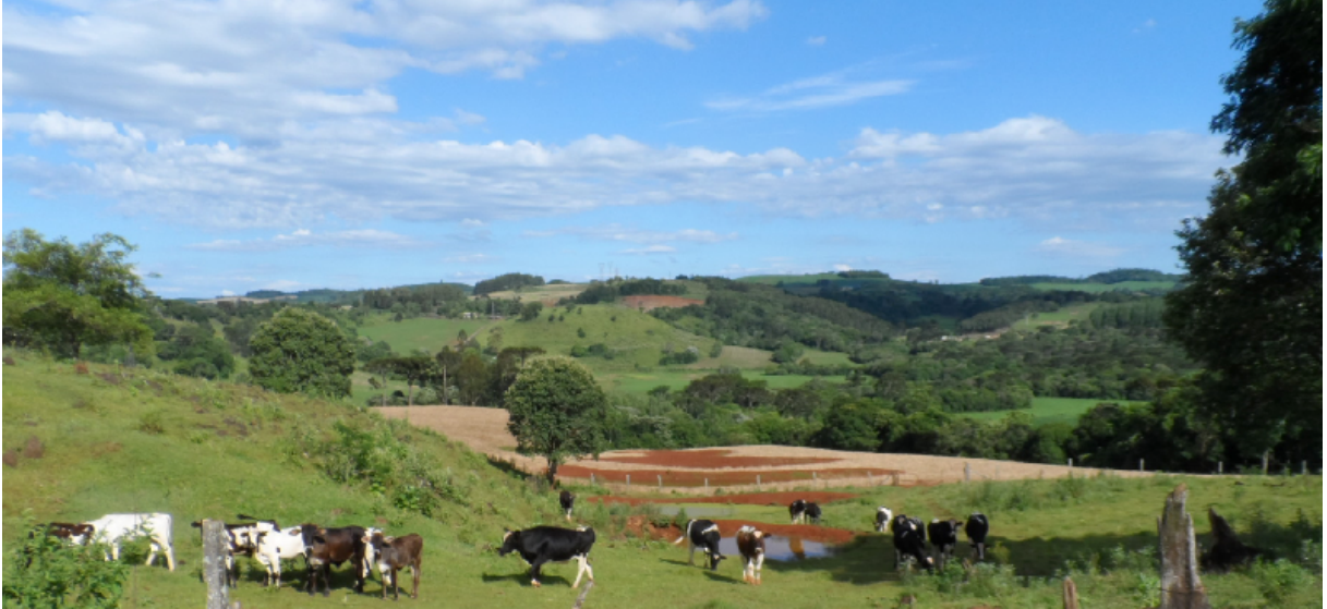
Figura 6 – Vista geral com áreas agricultáveis, presença de animais bebendo água em local inadequado.

percebido essa prática, justamente por não ter o isolamento correto nesses locais de nascentes.