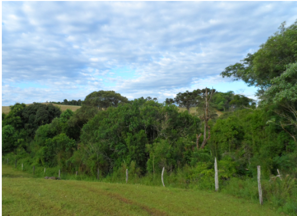
Figura 7 – Vista de área bem preservada, com a presença do campo de pastagem, a cerca isolando a mata ciliar, com inúmeras espécies de plantas nativas e ao fundo área de lavoura.

doméstica, devendo ser repovoada com espécies arbóreas nativas, para conservação e preservação destas nascentes.