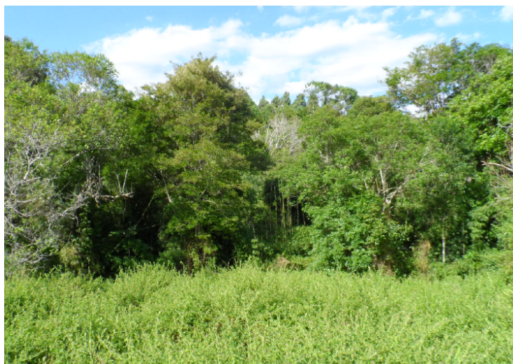
Figura 2 – Vista geral da mata, que está protegendo uma das nascentes do Rio Pato Branco, no Município de Mariópolis – PR.

Constatou-se, vários cenários referentes as nascentes, algumas mais protegidas e outras menos protegidas, sempre tendo ao seu redor algum tipo de vegetação nativa fazendo o papel da preservação do olho d'água.