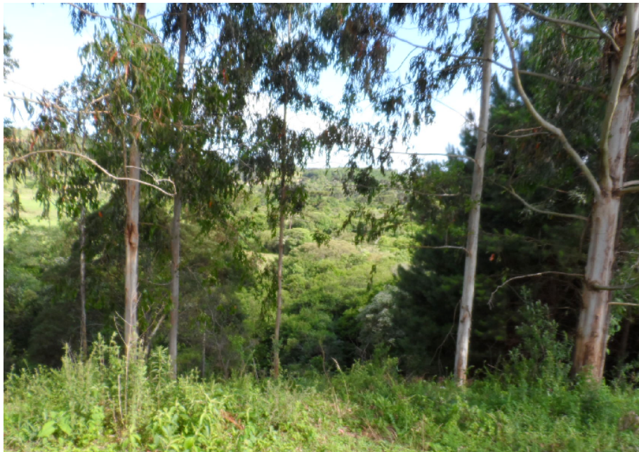
Figura 3 – Vista da mata sem acesso dos animais no Rio Pato Branco, ao fundo visualiza-se a passagem.

Em locais onde não há a presença de animais, local de mata virgem, em vez de passar uma cerca, será feito georreferenciamento para que futuramente essa área não seja invadida pela agricultura por exemplo, realizar a construção de marcos de concreto na linha onde passaria a cerca. Como ilustrado na figura abaixo, os marcos serão instalados no meio da vegetação rasteira presente na imagem: