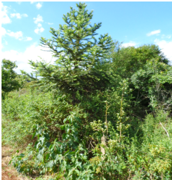
Figura 5 – Local com presença de cerca para preservação da Mata Ciliar, com muda de Araucária bem desenvolvida.

Existe em vários locais, a presença da cerca que foi construída no passado, tendo também, mudas de Araucária já bem desenvolvidas. Contudo, as cercas que estão bem conservadas, continuarão no local e as cercas a serem construídas, não serão de arames farpados e sim com fios lisos, para que não ocorra machucadura em possíveis animais que ali passarem.