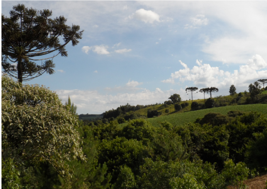
Figura 4 – Vista geral de área agricultável e mata com presença de espécies nativas, destacando-se a presença da Araucária ( Araucaria angustifolia ).

Os diagnósticos feitos nas propriedades, foram realizados através de questionário, quais as questões discutidas eram as seguintes: