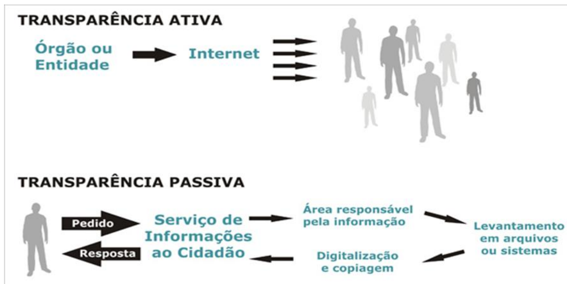
Figura 1. Transparência ativa e passiva