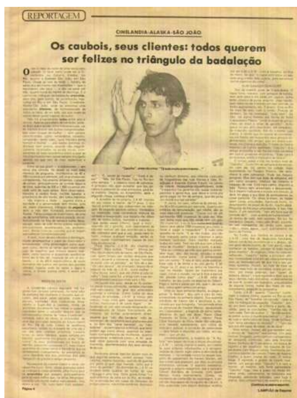
Figura 16 - Reportagem “Os caubóis, seus clientes: todos querem ser felizes no triângulo da badalação” de Lampião da Esquina

memória de eventos esparsos, evasivos e pouco aprofundados. Acredito que isso faz parte de um processo de apagamento da memória e (auto)silenciamento, que dificulta a articulação das experiências traumáticas, preservando o indivíduo de uma exposição dolorosa. Na edição 1 de 1978, o relato de J.A.M., jovem de 17 anos, parece trazer essa percepção na reportagem Os caubóis, seus clientes: todos querem ser felizes no triângulo da badalação .