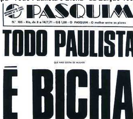
Figura 5 - Capa “Todo Paulista é Bicha” da Edição 105 de O Pasquin