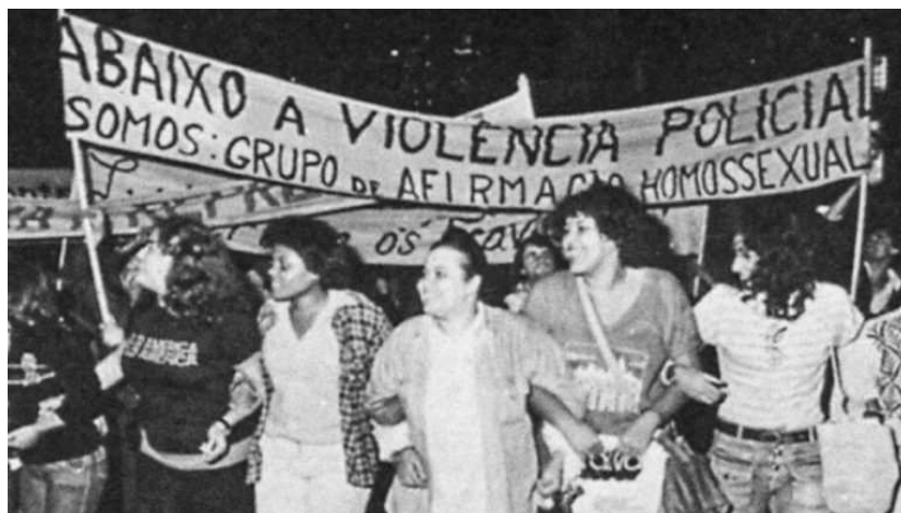
Figura 7 - Grupo Somos de Afirmação Homossexual em Marcha Contra Violência Policial da Ditadura