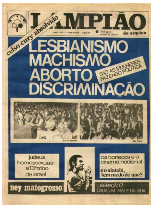
Figura 10 - Capa do periódico Lampião da Esquina da edição 11 de abril de 1979

Após a decisão de criar o jornal, surgiu a necessidade de definir seu nome. Inicialmente, cogitou-se o título Esquina , uma referência simbólica aos espaços urbanos onde pessoas homossexuais tradicionalmente se encontravam — pontos de socialização e reconhecimento mútuo, frequentemente situados em esquinas, consideradas territórios ambíguos entre o público e o privado. No entanto, como o nome já havia sido utilizado para registrar a editora responsável pela publicação, foi necessário buscar outra denominação. A escolha recaiu então sobre Lampião , em alusão ao objeto que iluminava justamente essas esquinas, os espaços de encontro e convivência da comunidade homossexual (Silva apud Gimenez, 2015, p. 30).