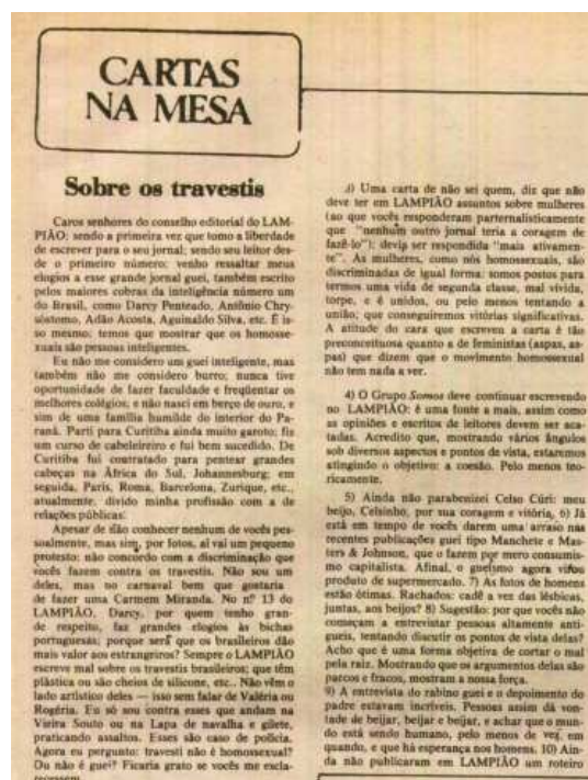
Figura 20 - Carta publicada na Coluna Cartas na Mesa da Edição 14 de Lampião da Esquina