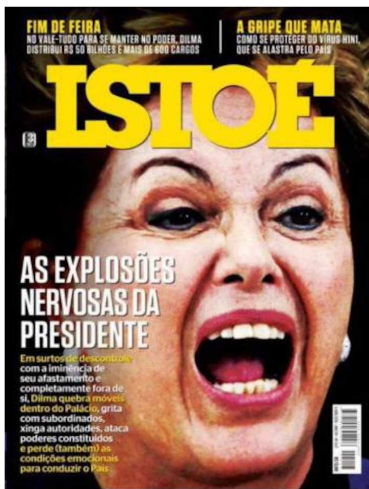
Figura 26 - Capa da Revista Veja em 2015 “As explosões nervosas da presidente”

Lamentavelmente, essa é uma estratégia comum e recorrente utilizada para descredibilizar mulheres em posições de trabalho, principalmente quando exercem cargos de liderança ou ocupam espaços de poder superiores aos de homens nos dias de hoje. A associação entre mulheres e descontrole emocional serve como instrumento de silenciamento e de reforço de estereótipos de gênero, que historicamente vinculam o feminino à irracionalidade e à instabilidade. Um exemplo é a capa da revista Veja , publicada em 2015, que retratou a então presidenta Dilma Rousseff com feições distorcidas e sugestão de histeria.