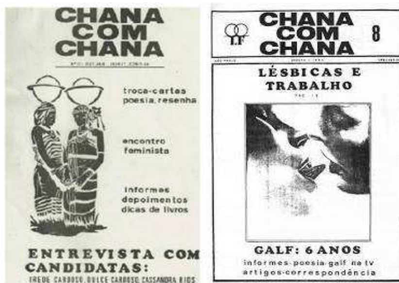
Figura 9 - Capa dos boletins ChanaComChana da edição 3 e 5

Um dos episódios mais emblemáticos envolvendo a revista ocorreu em 1983, quando ativistas do GALF foram impedidas de distribuir o boletim ChanaComChana no Ferro's Bar, um conhecido ponto de encontro LGBTQIAPN+ em São Paulo. Em resposta, organizaram um protesto que ficou conhecido como o "Stonewall brasileiro", marcando o 19 de agosto como o Dia do Orgulho Lésbico no Brasil.