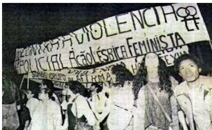
Figura 8 - Grupo de Ação Lésbico Feminista em 1978

Sobre a atuação de grupos e entidades voltadas a questões de direitos homossexuais, há a menção de que o grupo SOMOS passou por divisões internas, resultando na formação de três novos coletivos: o próprio SOMOS, o Grupo Lésbico-Feminista, que mais tarde adotaria o nome Grupo de Ação Lésbico-Feminista (GALF), e o Grupo de Ação Homossexualista, posteriormente renomeado como Outra Coisa. Aqui, mais uma vez, se percebe a questão da interseccionalidade na história do movimento LGBTQIAP+ brasileiro. Como salienta Akotirene (2018), a interseccionalidade permite enxergar o colapso das estruturas sociais dentro das militâncias. Foram “rachas” que, apesar da fragmentação, trouxeram articulações mais específicas visando atender a especificidades de cada pauta, juntamente com os movimentos feminista e negro (Fachinni, 2003, p. 84).