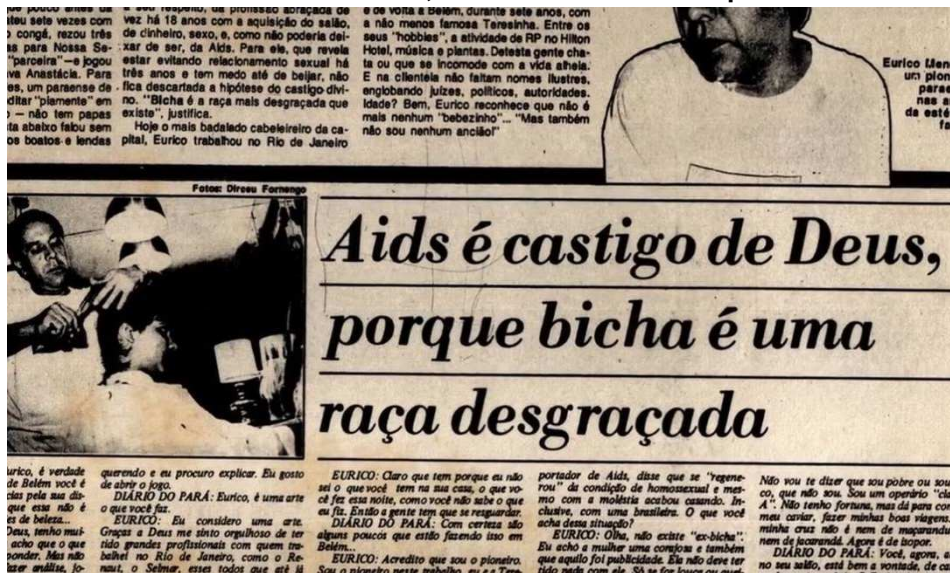
Figura 11 - Jornal da década de 1980, exibido no filme Carta para Além dos Muros

engajamento e atuação. Esta mudança foi caracterizada como uma segunda onda do movimento homossexual brasileiro (Fachinni, 2003).