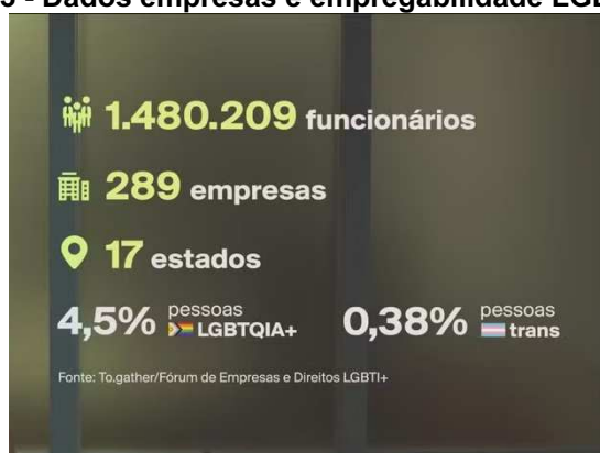
Figura 3 - Dados empresas e empregabilidade LGBTQIAP+

empregabilidade trans. Vale ressaltar, entretanto, que as empresas que participaram dessa pesquisa já têm experiência com políticas de diversidade. Entre elas, 61% afirmam que empregam pessoas trans atualmente, e cerca de 16% afirmam ter pessoas trans em cargos de liderança. No entanto, na maioria desses casos, as vagas ocupadas por pessoas trans representam menos de 1% do total de funcionários contratados da empresa.