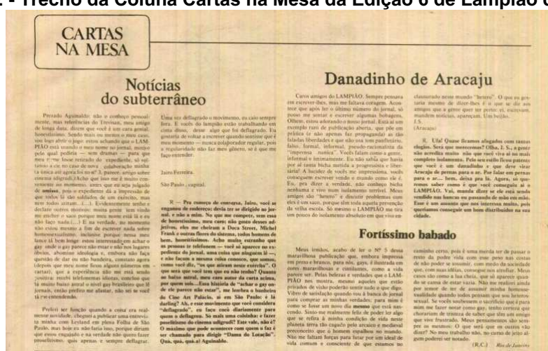
Figura 22 - Trecho da Coluna Cartas na Mesa da Edição 6 de Lampião da Esquina

A estratégia de esconder a sexualidade no ambiente de trabalho, nesse sentido, é um ponto de destaque. Na sequência, trago um relato apresentado em Lampião da Esquina por R.C., do Rio de Janeiro, publicado na seção Cartas na Mesa, edição 6, p. 15.