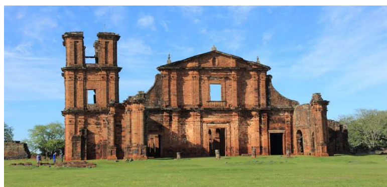
Figura 1 - Ruínas de São Miguel das Missões

Próxima à região onde nasci, no interior do Rio Grande do Sul, localiza-se a cidade de São Miguel das Missões, hoje conhecida pelas ruínas de São Miguel. O local, declarado Patrimônio Mundial da UNESCO em 1983, é um território que foi, historicamente, cenário da violenta destituição identitária e cultural dos povos guaranis que ali viviam. Embora atualmente apresentado como símbolo de preservação histórica dos antigos povoados jesuítas estabelecidos na região sul do país, é fundamental reconhecer que esse “patrimônio” também carrega as marcas de um projeto colonizador que impôs apagamentos profundos às culturas originárias daquela região.