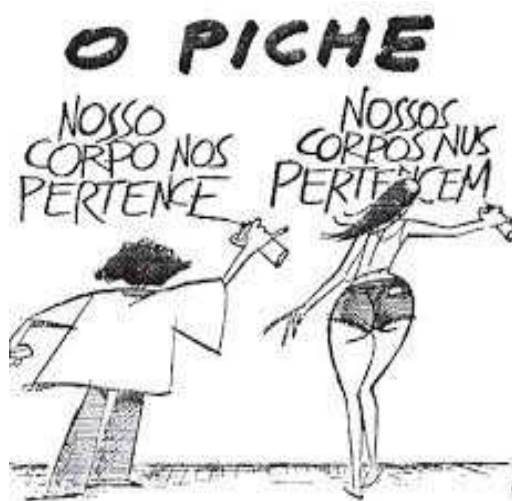
Figura 4 - Charge de Ziraldo

O Pasquim surgiu como uma forma de resistência e crítica ao governo autoritário da época. Os cartuns, charges e textos presentes em O Pasquim, eram uma forma de protesto contra a censura e as arbitrariedades do regime militar. Entretanto, o jornal, apesar de ser um dos mais importantes e influentes do período, acabava por reproduzir no seu interior muitos daqueles pensamentos conservadores que ancoravam o regime (Barbosa, 2018, p. 20). Isto podia ser evidenciado em suas matérias, entrevistas ou charges que traziam, no seu humor, uma desqualificação do movimento feminista brasileiro que surgia no período: