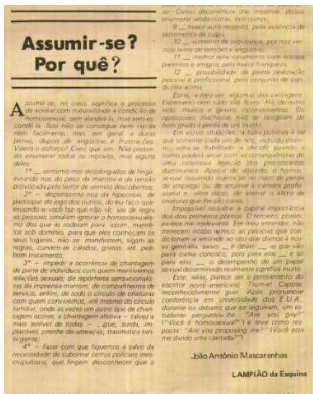
Figura 18 - Reportagem “Assumir-se? Por quê?” de Lampião da Esquina

reportagem de Lampião da Esquina, em seu artigo de opinião, no qual ele busca explicar por que assumir-se – ou passar pelo processo de saída do armário –, pode ser uma estratégia para evitar chantagens familiares e proporcionar uma maior autonomia aos indivíduos homossexuais. A reportagem está presente na edição 2 de Lampião.