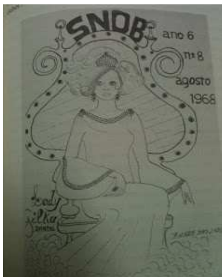
Figura 6 - Capa do número 95 de O Snob de 1965.

De um jornalzinho mimeografado e minimalista, com simples desenhos a traço de modelos femininos, O Snob tornou-se uma publicação que incluía cerca de trinta a quarenta páginas, trazendo ilustrações elaboradas, colunas de fofocas, concursos de contos e entrevistas com os famosos travestis do momento (Green, 2000, p. 298).