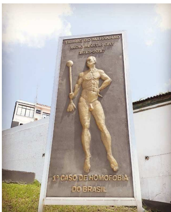
Figura 2 - Monumento em homenagem a Tibiras do Maranhão